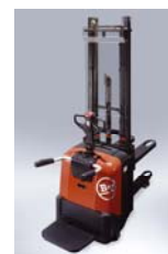
Catégories 3 ou 5 avec formation complémentaire